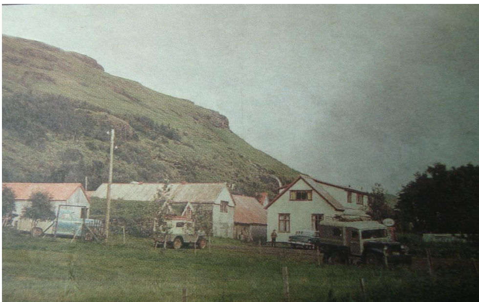
Jeppes billede fra Múlakot 1960

10. júlí. Málarinn var sjálfur kominn á fætur til að kveðja okkur þegar við vorum að fara. Frá Djúpadal urðum við að ganga það sem eftir var leiðarinnar. Elsti hluti bæjarins að Keldum er frá 13. öld og yngsti hlutinn er notaður enn þann dag í dag. Það var mjög áhugavert að sjá alla þessa gömlu hluti sem þeir notuðu hér áður fyrr. Á leiðinni áfram fórum við gegnum Hveragerði sem er næstum eingöngu gróðurhús sem fá hita úr hverunum og það rýkur alls staðar. Hér eru m.a. ræktaðir bananar. Síðla kvölds náðum við 'Teigunum'.