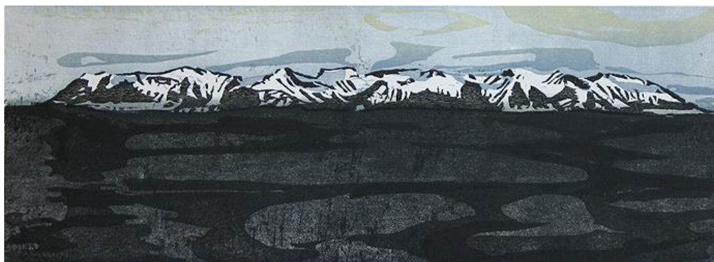
Michael Herstand: Across Eyjafjörður. 2007 Woodcut on paper.