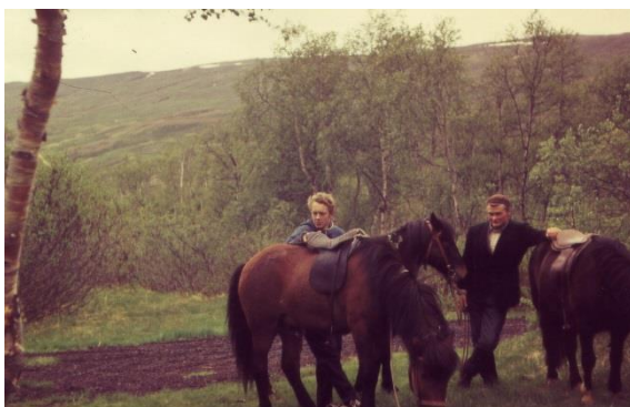
Jeppe í Vaglaskógar

Kæri afi! Bestu þakkir fyrir bréfið og fyrirgefðu að ég svara svo seint, en þú veist að við höfum í mörgu að snúast. Mér heyrðist í síðasta bréfinu þínu að þú hefðir áhyggjur af hvernig okkur gangi að komast yfir vötnin á Suð-austurlandi. En ég get hughreyst þig með að við áætluðum að fara héðan til Austurlands og svo tala við staðkunnuga til að koma okkur yfir árnar og ef þeir halda að það sé einhver hættu á ferðum biðum við eftir skipi sem getur flutt okkur og hestana til suðurlands. Þú skrifar að við ættum frakar að riða vestur fyrir jöklana en eftir því sem mér sýnist á kortinu er mjög lítið gras fyrir hestana inni á hálendinu og við getum ekki tekið mikið hey með okkur þegar við höfum bara tvo hesta. Auk þess hefur okkur verið sagt að svæðið vestur af jöklunum er ansi torfært fyrir hestana. Þú getur alla vega verið rólegur yfir að við tökum engar áhættur. Það gengur annars mjög vel með hestana núna. ... Ég hef hugsað mér að skrifa einskonar dagbók í ferðinni sem hefst föstudaginn 10. og ég sendi hana svo heim jafnóðum. Ég ætla að biðja þig að geyma hana svo ég geti safnað bútonum saman þegar ég kem heim. En nú megið þið ómögulega verða hrædd um mig ef það líður lengri tími milli bréfanna. Þú veist hvernig aðstæður eru á Austurlandi. ... Nú vona ég að þú sért orðinn rólegri við að lesa þetta bréf og svo vil ég enda það með að senda kærar kveðjur til ykkar allra. Jeppe.