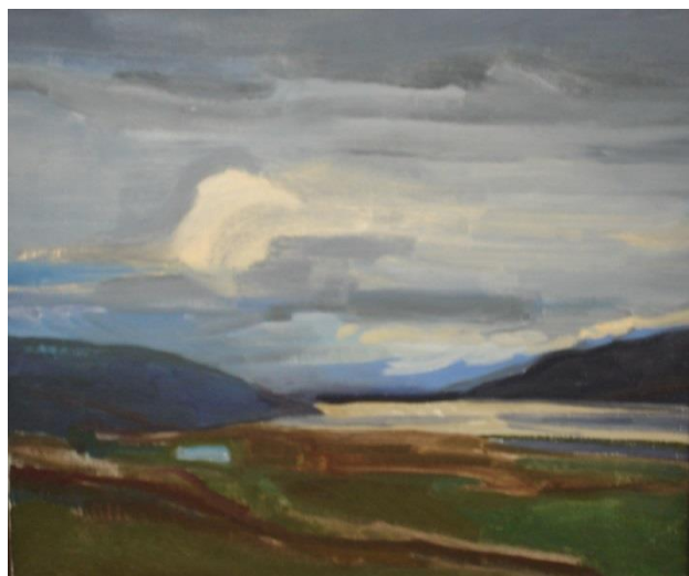
Kamilla Talbot: Summer Light. 2007