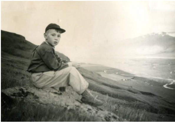
Uppi í brekku, séð yfir Múlakot