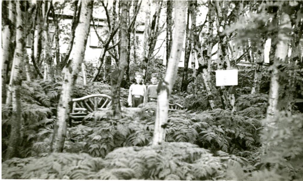
Mynd úr garði ásamt Þórði Jónssyni